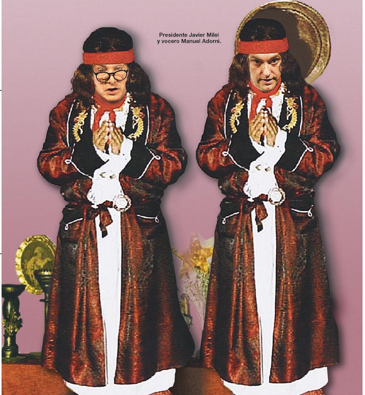
Presidente Javier Milei y vocero Manuel Adorni.