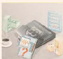
ILUSTRACIÓN: FRANCISCO MAROTTA