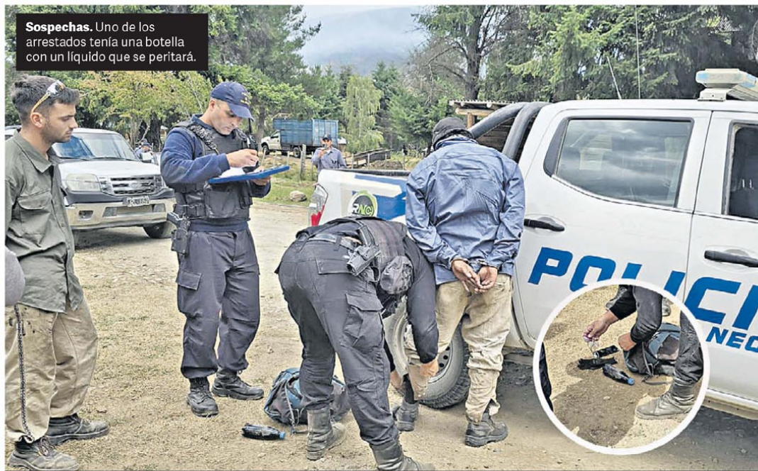
Sospechas. Uno de los arrestados tenía una botella con un líquido que se peritará.

El ministro de Economía dijo que en la negociación con el organismo, "la devaluación no es un tema". Y que el acuerdo tampoco implica la salida del cepo "al día siguiente". Insistió con que el equilibrio fiscal "no se va a arriesgar de ninguna forma". P. 20