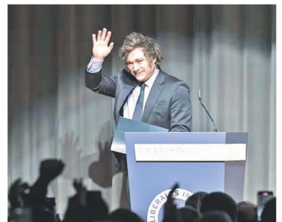
También analiza dejar el Acuerdo de París

Milei sigue los pasos de Trump y retira a la Argentina de la OMS