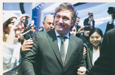
Siguen las repercusiones del discurso que dio en Davos

Aceiteras y cerealeras liquidaron en enero más de 2.000 M de dólares PÁG. 2