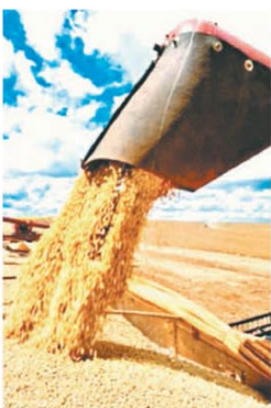
El ingreso de divisas de la agroindustria subió 36%

Las reservas netas del Banco Central tienen un registro negativo en torno de los USD10.000 M