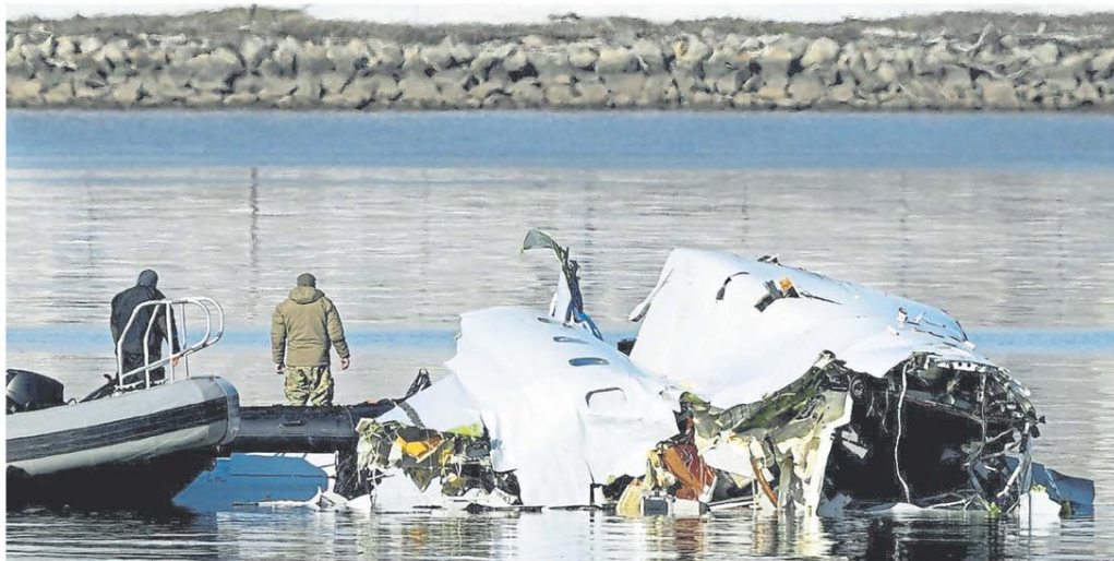
Investigadores del gobierno federal revisan los restos del avión de American Airlines

COLISIÓN. Un helicóptero militar chocó contra un avión de American Airlines; un argentino, entre las víctimas