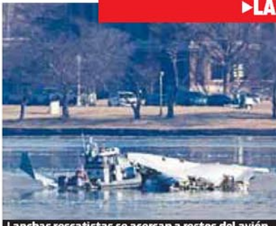
Lanchas rescatistas se acercan a restos del avión.

► LAS AUTORIDADES CONFIRMARON QUE NO HAY SOBREVIVIENTES ◀