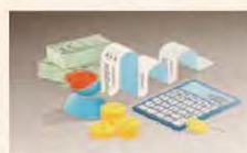
ILUSTRACIÓN: FRANCISCO MAROTTA

Hernán de Goñi Director Periodístico — p. 2 —