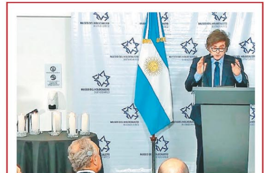
Destacó que el empresario es "defensor del Estado de Israel"

La Corte de EE.UU. falló contra Argentina y habilitó la posibilidad de embargos PÁG. 4