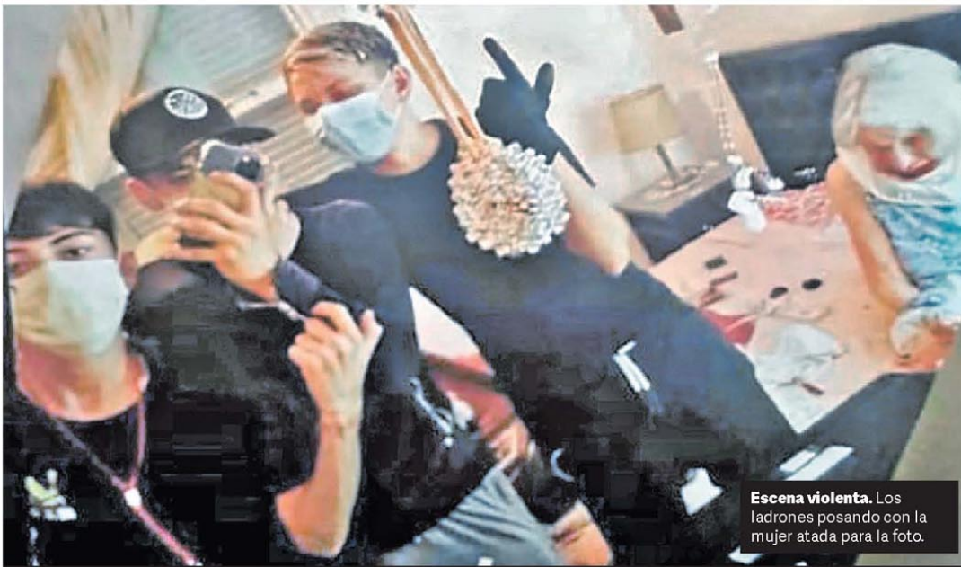
Escena violenta. Los ladrones posando con la mujer atada para la foto.

El interventor del municipio salteño de Aguas Blancas, que limita con Bolivia, llamó a la licitación para desplegar el alambrado. Es parte del Plan Güemes que lanzó la ministra de Seguridad, Patricia Bullrich, junto al gobernador de Salta, Gustavo Sáenz, para un mayor control de las fronteras. La cancillería boliviana rechazó la decisión y pidió un mayor diálogo. P.6