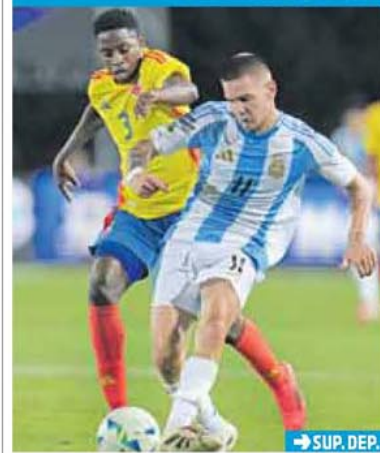
→ SUP. DEP.