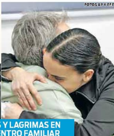
ABRAZOS Y LAGRIMAS EN REENCUENTRO FAMILIAR

El primer día del alto el fuego en la Franja de Gaza culminó en éxito con la liberación de tres rehenes mujeres israelíes y 90 prisioneros palestinos, la mayoría mujeres y niños. Cómo sigue la entrega de rehenes, entre ellos argentinos. → VER 13 A 15