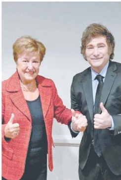
Optimismo para lo que viene

Llegará la próxima semana, con el cepo, la tasa y el tipo de cambio como principales disyuntivas