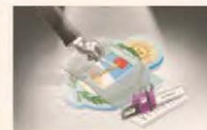
ILUSTRACIÓN: FRANCISCO MAROTTA

Equilibrio fiscal y el precio de los activos argentinos