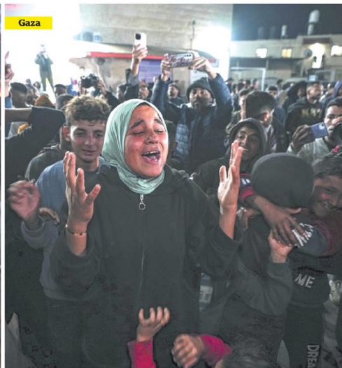
Festejos palestinos en Deir al-Balah, Franja de Gaza