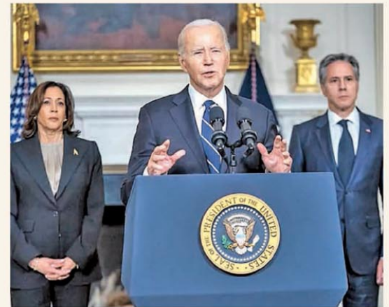
El anuncio del acuerdo fue realizado por Joe Biden

Ejecutivos de finanzas estiman que el cepo se mantendrá hasta octubre PÁG. 4