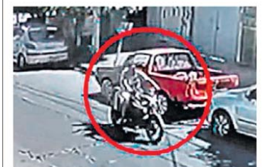
San Justo. Escape con un disparo mortal.