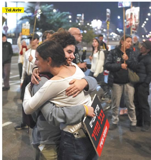
Alivio de familiares de rehenes israelíes en Tel Aviv

INSEGURIDAD. La zona oeste del conurbano fue atravesada ayer por otra ráfaga de violencia criminal con un saldo aterrador: una mujer de 45 años fue asesinada delante de su hija cuando delincuentes dispararon contra un colectivo en San Justo (La Matanza), mientras que un policía porteño murió en Castelar (Morón) al ser atacado por motorchorros que lo asaltaron cuando estaba de civil. Página 22