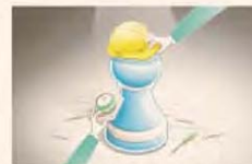
ILUSTRACIÓN: FRANCISCO MAROTTA