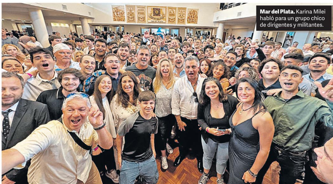
Mar del Plata. Karina Milei habló para un grupo chico de dirigentes y militantes.

Luego de varios años de un mercado inmobiliario prácticamente paralizado, las compras y ventas de propiedades porteñas comenzaron a repuntar y 2024 cerró con 5.755 escrituras realizadas. Para buscar números más altos hay que ir hasta 2017, cuando se cerraron 6.805 operaciones. Palermo, Belgrano y Caballito siguen siendo los barrios porteños más buscados. P.30