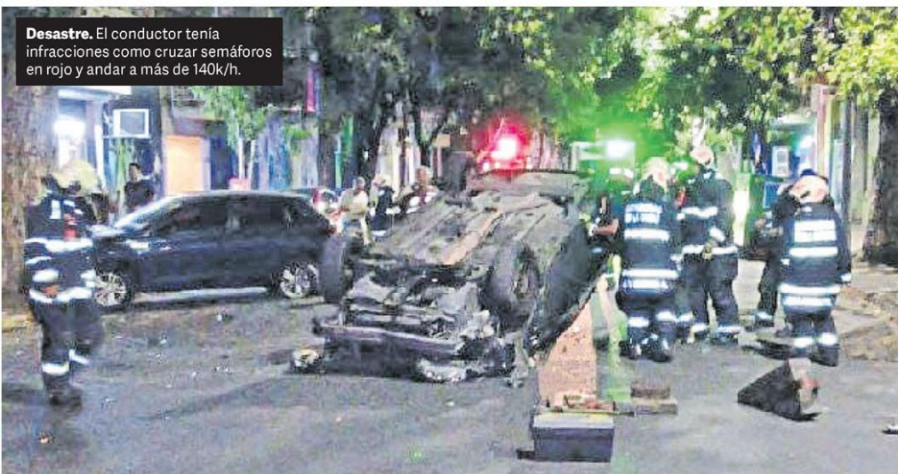
Desastre. El conductor tenía infracciones como cruzar semáforos en rojo y andar a más de 140k/h.

Ante la ola de calor anunciada para esta semana, un informe de Cammesa anticipa un pico de consumo. El récord podría marcarse el jueves. Para que el servicio no se resienta se analiza la posibilidad de importar energía. Y se lanzan recomendaciones a los usuarios sobre uso de aire acondicionado y otros electrodomésticos. P.14