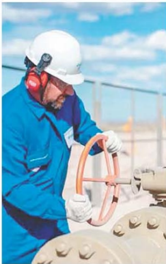
Energía y agro, los motores

La economía creció por sexto mes y quedó 0,5% por encima del nivel de noviembre de 2023