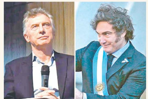
Escala la tensión entre el ex presidente y Milei

Se triplicó la cantidad de empresas que emitieron obligaciones negociables PÁG. 3