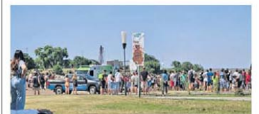
Paseo Costero. Hay advertencias por el río.

una mirada y escapó del lugar. Los vecinos alertaron al 911. El motociclista está identificado y lo busca la Policía. P.36