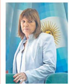
La ministra contra la vice

Villarruel y Bullrich se cruzaron por la situación del gendarme en Venezuela