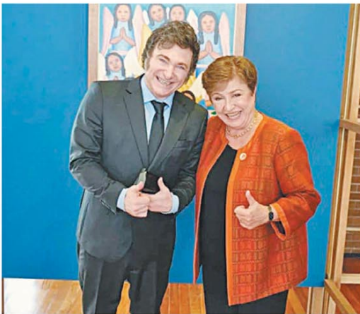
El último encuentro entre Milei y Georgieva

El Gobierno inició formalmente las tratativas para un programa que incluya desembolsos y evalúa cuándo levantar el cepo