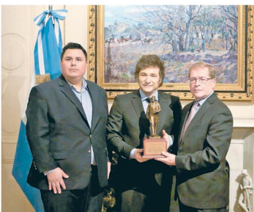
El Presidente recibió el Premio al Legado de Ronald Reagan de manos de Grover Norquist y Jonás Torrico

El resultado positivo acumula 0,6% del PBI. El último mes se apoyó en la reducción de partidas de obras públicas y de educación