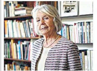
Ensayista y crítica literaria. Tenía 82 años.

El dólar paralelo cerró en $ 1.165, un avance de $ 40 ayer, y de $ 110 desde la semana pasada. También subieron los dólares financieros. En el mercado explican que la baja de tasas del Banco Central y la mayor demanda por el verano afuera vuelven a poner presión al tipo de cambio. Ayer, el ministro Luis Caputo suscribió esa explicación y anunció que se firmará un acuerdo con el Fondo Monetario en 2025. P. 16