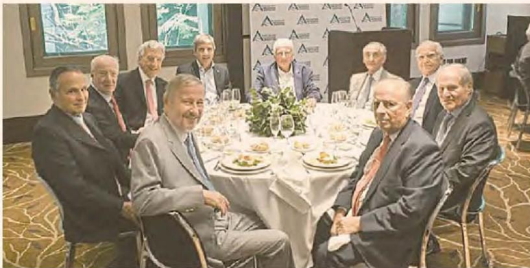
EL MINISTRO DE ECONOMÍA ALMORZÓ CON LA CÚPULA DE AEA

Merval 2.592.200 ▲ 1,93% — Dow Jones 43.449 ▼ -0,61% — Dólar BNA 1042 ▲ 0,05% — Euro 1,05 ▼ -0,19% — Real 6,10 ▼ -0,79% — Riesgo país 673 ▼ -0,59%