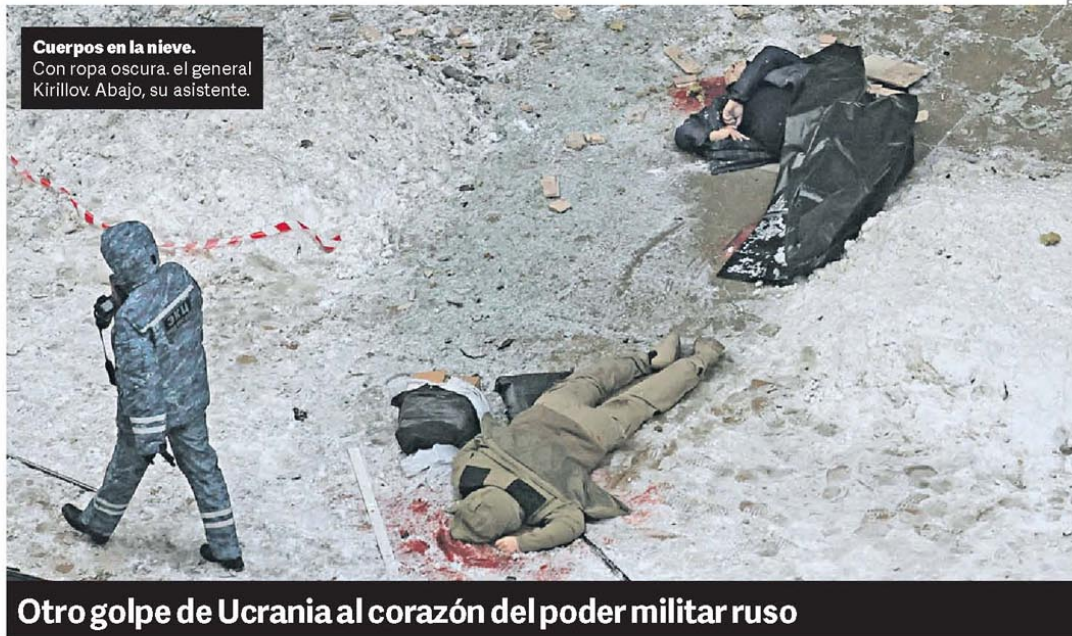
Cuerpos en la nieve. Con ropa oscura, el general Kirillov. Abajo, su asistente.

Nuevo 2 en la SIDE. Es Diego Kravetz, actual secretario de Seguridad en Ciudad.