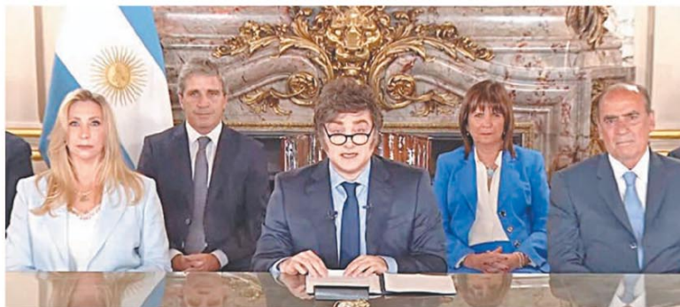
El mandatario estuvo flanqueado por Karina Milei y por Guillermo Francos

En su visita a la Rural, prometió al campo que terminará con las retenciones