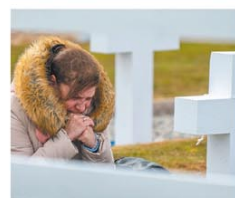
Evocación en el cementerio

DARWIN (Islas Malvinas). —Unos 150 familiares de caídos en la Guerra de Malvinas viajaron a las islas y visitaron el Cementerio de Darwin. El contingente fue acompañado por periodistas, entre ellos LA NACION, y estuvo integrado, entre otros, por 26 personas de más de 85 años. Entre la memoria y el dolor, se recordó a los soldados muertos en el hundimiento del ARA General Belgrano. Página 17