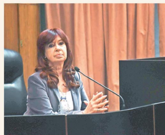
Se abre otro frente judicial para la ex presidenta

A lo largo de octubre se movilizaron m s de 38 millones de personas. El 5% de ese incremento estuvo impulsado por el mercado dom stico de Colombia. P G. 9