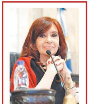
Pidió cambios electorales

A pesar de las críticas, el PRO votó la continuidad de Menem