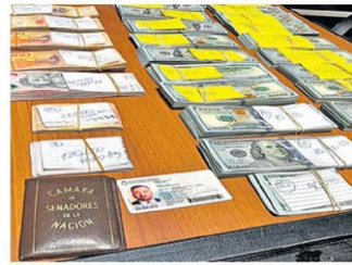
Incautados. Dólares y pesos de Kueider.

vestigado por enriquecimiento ilícito y lavado de activos en los tribunales entrerrianos, el senador -que pedirá licencia en el Congreso- se convirtió en un aliado clave de la Rosada y aportó su voto para aprobar la Ley Bases. "Lo de Kueider es un tema del kirchnerismo", aseguró el presidente Milei. P.3