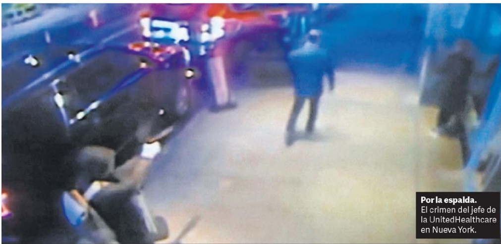
Por la espalda. El crimen del jefe de la UnitedHealthcare en Nueva York.

Los dos se extremos se unieron para una moción de censura que obligó a la renuncia de Michel Barnier y su gabinete. Fue por el presupuesto que el ex premier había presentado para enfrentar el enorme déficit y su ley de seguridad social. Es la primera vez desde 1962 que cae un gobierno francés por censura. El presidente Macron quedó debilitado y busca reemplazante de Barnier. P.28