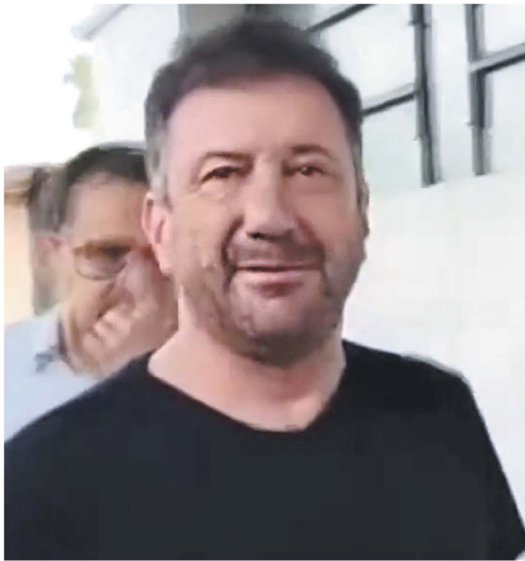
El senador Kueider, ayer, al ingresar a una sede judicial en Paraguay