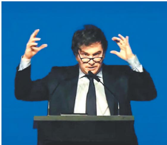
El presidente en la cumbre CPAC con críticas a la oposición

El presidente Javier Milei formalizó el llamado. Incluye reforma electoral, política y de fueros; juicio en ausencia y Ley antimafia