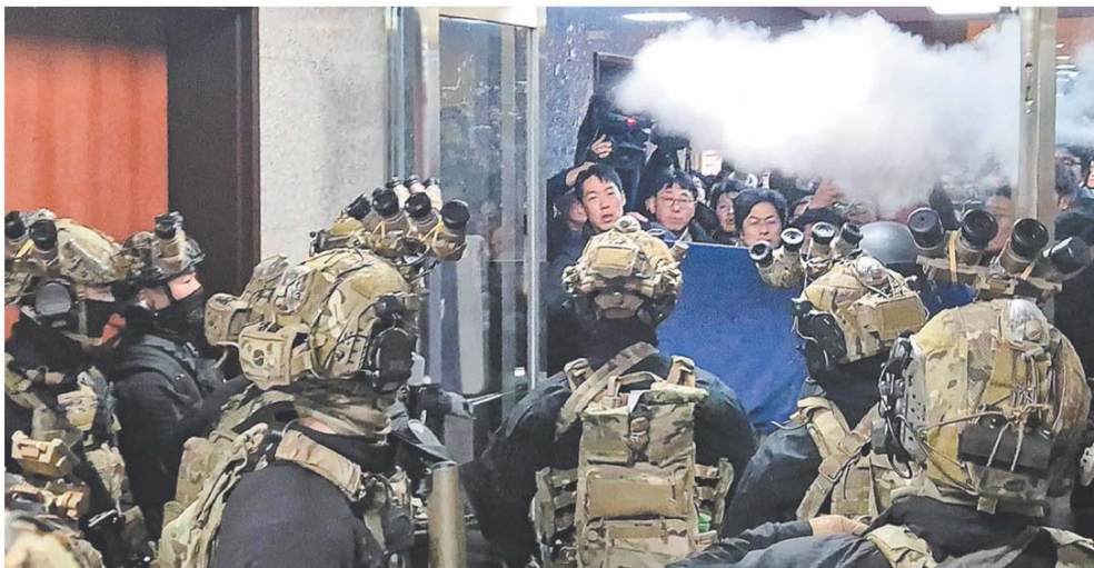
Soldados ingresan al Parlamento después de que el gobierno de Seúl acusara a la oposición de haberlo tomado

La política es dinámica, inquietada, imprevisible. El jueves pasado, luego del fracaso de la reunión de la Cámara de Diputados convocada para tratar el proyecto de ficha limpia, la rumorología política insistía en que habían quedado muy mal ante la opinión pública los diputados que promovieron esa ley y que, por segunda vez en una semana, no habían conseguido quorum para que el proyecto sea tratado. Al día siguiente, el propio Presidente se dio cuenta de que el primer afectado había sido él. Continúa en la página 10