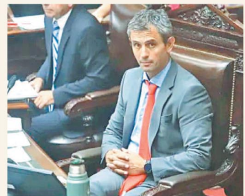
Sesión especial para definir las autoridades en Diputados