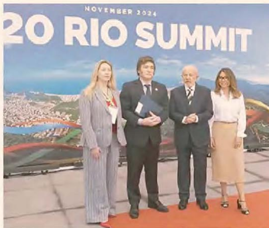
Milei y Lula durante su último encuentro, en la Cumbre del G20 en Rio

Inversores y empresarios miran la situación de Brasil con preocupación. No hay temor a una crisis, porque los números de la macro del país vecino son buenos: esperan cerrar 2024 con crecimiento mayor a 3%. Pero la desconfianza del mercado sobre la situación fiscal y la sostenibilidad de su deuda en reales sacudió a su moneda. En lo que va del año, el dólar subió 20%, poniendo presión a mediano plazo al vínculo comercial. El ministro de Economía brasileño, Fernando Haddad, se reunió con líderes del Congreso y habló el viernes ante los grandes bancos, para ofrecer garantías sobre medidas ya en marcha. En este contexto, la Argentina está decidida a avanzar con posturas a favor de replantear el funcionamiento actual del Mercosur. La otra gran apuesta será cerrar el acuerdo con la UE. — P. 8 y 14