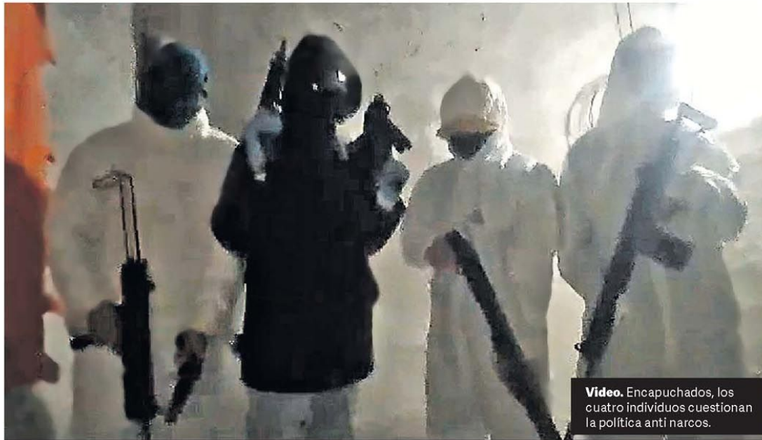
Video. Encapuchados, los cuatro individuos cuestionan la política anti narcos.

Desde hoy el pasaje en todas las estaciones de la red de subterráneos se puede abonar con tarjetas de crédito, débito y prepaga. Esto disparó una feroz competencia entre los bancos y Mercado Pago. Mientras que los pagos con código QR como los que impulsa la empresa deberán esperar unas semanas, los bancos lanzaron una agresiva campaña de bonificaciones. P.18