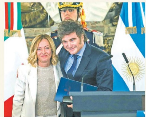
Encuentro bilateral luego de la Cumbre del G20

Sintonía fina entre Milei y Meloni con acuerdos políticos y económicos