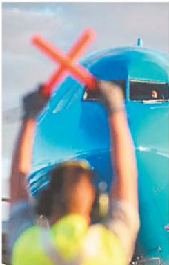
La semana pasada hubo paros

El INDEC dará a conocer la inflación de octubre, que según lo estimado perforó el piso del 3%