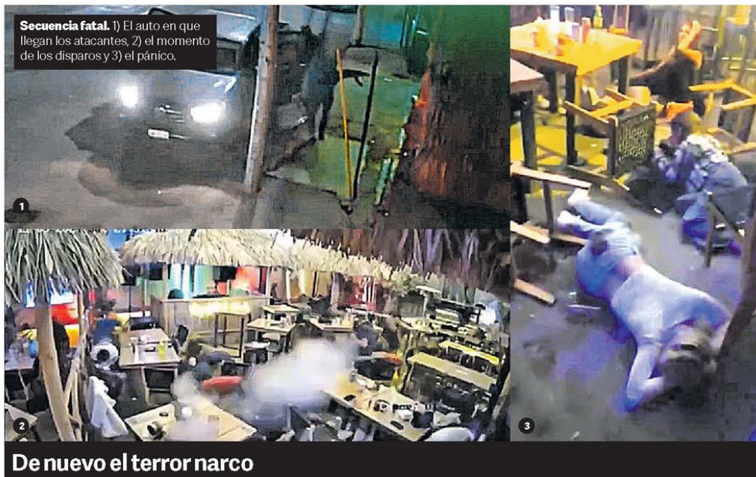
Secuencia fatal. 1) El auto en que llegan los atacantes, 2) el momento de los disparos y 3) el pánico.