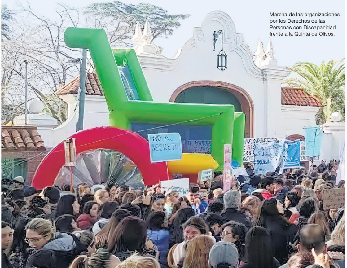
Marcha de las organizaciones por los Derechos de las Personas con Discapacidad frente a la Quinta de Olivos.