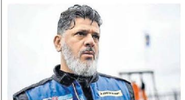
Otero. No le reclaman los US$ 5.800 millones.

El Gobierno anunció la desregulación del servicio postal para fomentar la competencia entre las empresas. A partir de ahora, para ser operador postal, las personas jurídicas sólo deberán inscribirse de manera electrónica e iniciar la actividad a los 5 días. El Correo Argentino pierde la exclusividad del envío de cartas documento, telegramas y encomiendas de hasta 50 kilos. P.14