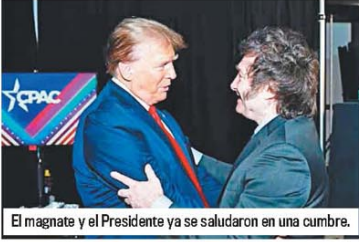
El magnate y el Presidente ya se saludaron en una cumbre.

Viernes 8 de Noviembre de 2024 • Buenos Aires • AÑO 61 • N° 21.632 • $1.000,00 • RECARGO POR ENVÍO AL INTERIOR $200,00