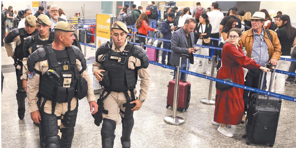
Efectivos de la Prefectura desembarcaron ayer en el Aeroparque ante el caos sindical

El futuro de Aerolíneas, entre la intervención o una nueva línea Página 12