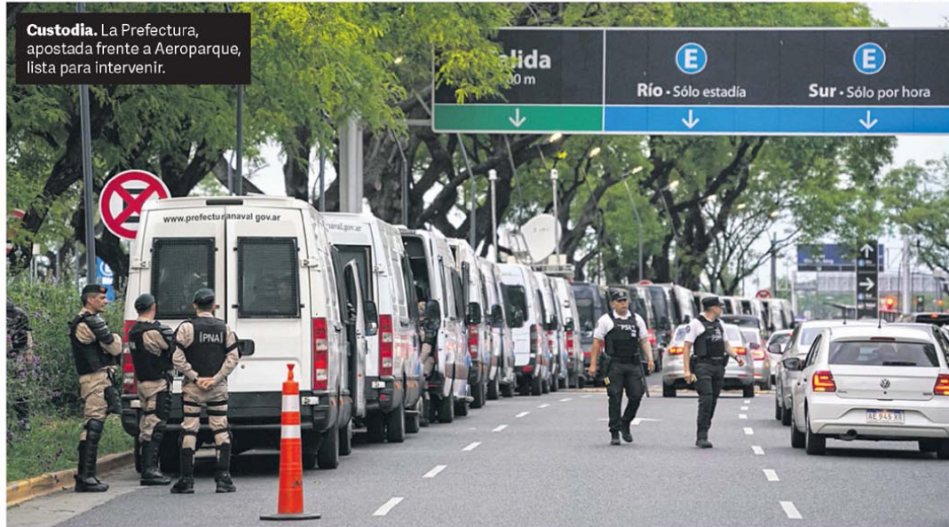
Custodia. La Prefectura, apostada frente a Aeroparque, lista para intervenir.