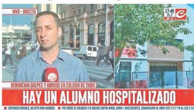
HAY UN ALUMNO HOSPITALIZADO