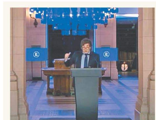
Milei apuntó el sábado contra las casas de altos estudios

En plena primaverita financiera, Caputo y Milei hablarán en IDEA PÁG. 3