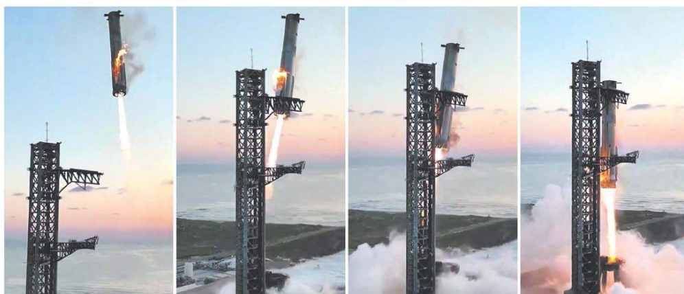
CAPTURAS DE VIDEO

elmundo —BOCA CHICA, Texas (AP).— SpaceX, de Elon Musk, logró ayer un hito en la exploración espacial al recapturar con éxito el propulsor de su megacohete Starship, tras un vuelo de casi nueve minutos. Se trata de un paso crucial hacia el objetivo de la compañía de hacer que los viajes espaciales sean más accesibles y económicos. En una maniobra espectacular, los brazos mecánicos instalados en la torre de lanzamiento capturaron el aparato y lo inmovilizaron. "Amigos, es un día para los libros de historia de ingeniería", dijo un vocero de SpaceX en medio de festejos durante la transmisión. Página 8