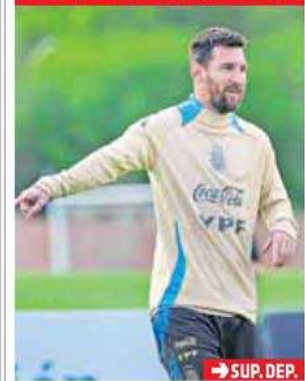
→ SUP. DEP.

Scaloni prepara variantes para recibir a Bolivia